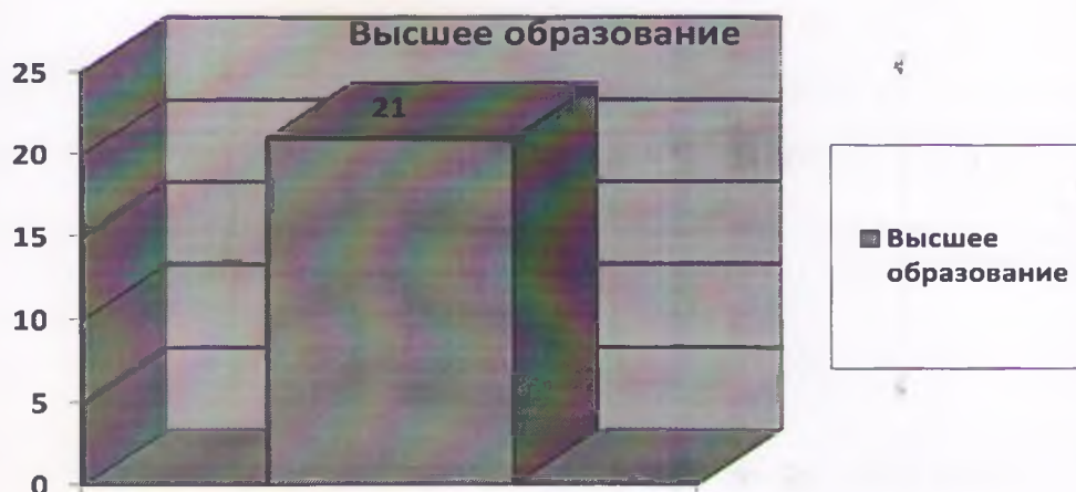
Рис.2 Уровень профессионального образования педагогических работников ДЭБЦ №4 2020 год